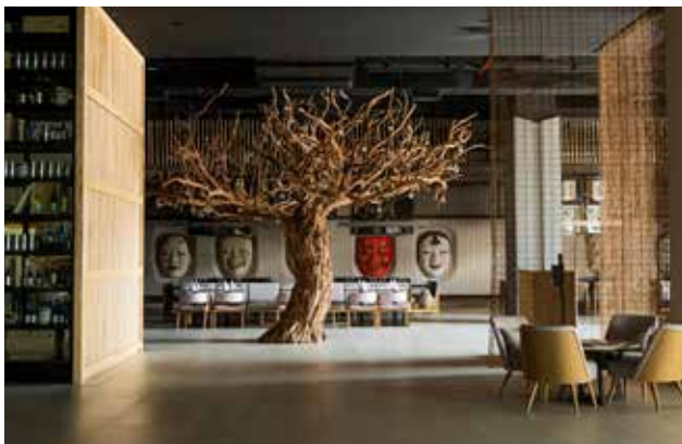
■ Restaurante Japonés

BARCELÓ MAYA ARENA ES EL RECINTO PARA EVENTOS MÁS GRANDE EN EL DESTINO