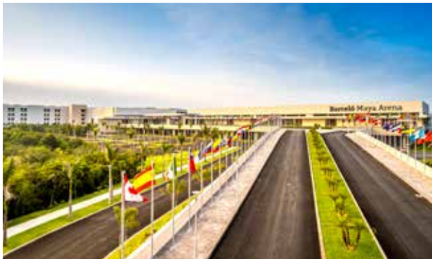
■ Centro de Convenciones